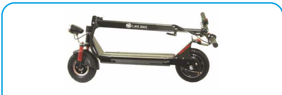
Механізм швидкого складання