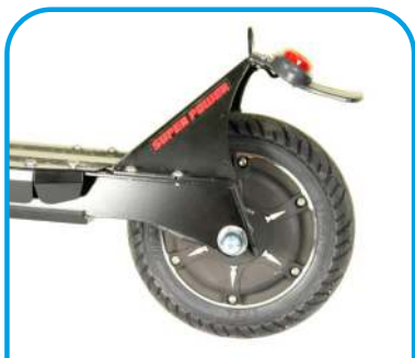
Мотор-колесо із барабаним гальмом