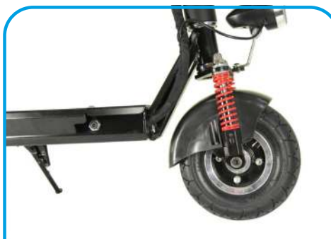
Світлодіодна фара та амортизатори