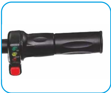
Ручка акселератора та індикатор заряду