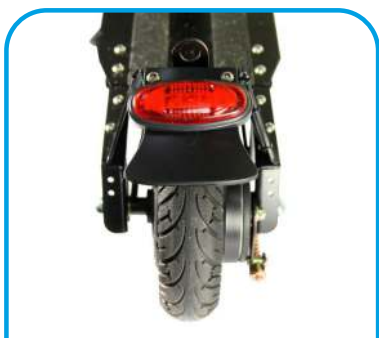
Цільне заднє колесо