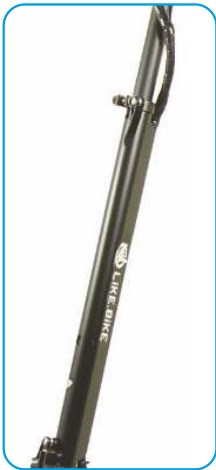
Можливість налаштування відповідно до зросту