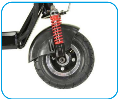
Переднє колесо із камерою