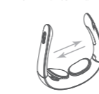
Регульована масажна голівка

Режим 1: Автоматичний (режим за замовчуванням)