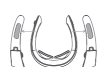
Електроди з обох сторін масажної голівки будуть нагріватись одночасно.

Режим 3: Циркуляційний Режим 4: Режим постукування