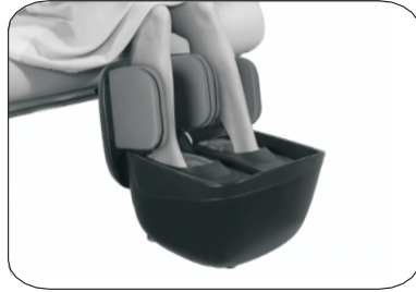
Мал.2. Масажер для стоп та литок