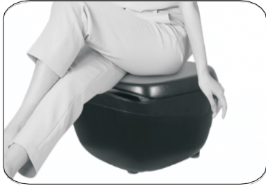
Мал.1. Пуф з підігрівом