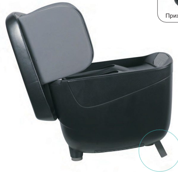
Розширене опорну планку

• ПРИМІТКА: Не встановлюйте і не використовуйте пристрій у ванній кімнаті або подібних вологих приміщеннях.