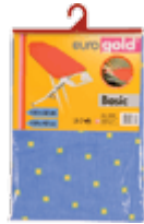
Чехлы для гладильных досок